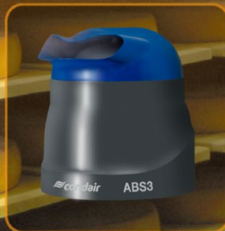
Condair ABS3: der Kombistarke

In Industrie- und Gewerberäumen mit bis zu 500 m 3 Rauminhalt entfaltet der Condair 3001 seine volle Leistung. Der Richtaufsatz lenkt den Aerosolnebel genau dorthin, wo Sie ihn benötigen – der Austrittspunkt lässt sich stufenlos einstellen. Sie können den Tank des Condairs 3001 manuell nachfüllen oder das Gerät vollautomatisch, d. h. mit Anschluss ans Wassernetz, betreiben. Der Thermoschutzschalter schaltet es in jedem Falle ab, wenn das Wasser knapp wird. Das garantiert höchste Betriebssicherheit.