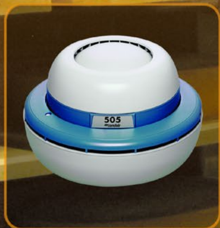
Condair 505: der Universelle

Horizontal oder vertikal? Die Richtaufsätze dieses kompakten Zerstäubers lassen den feinen Aerosolnebel tropfenfrei in die gewählte Richtung austreten. Das Gerät lässt sich mit wenigen Handgriffen reinigen. Und Sie entscheiden, ob Sie Ihren Condair 505 ans Wassernetz anschliessen möchten oder den Wassertank manuell nachfüllen wollen.