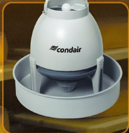
Condair 3001: der Supersichere

Horizontal oder vertikal? Die Richtaufsätze dieses kompakten Zerstäubers lassen den feinen Aerosolnebel tropfenfrei in die gewählte Richtung austreten. Das Gerät lässt sich mit wenigen Handgriffen reinigen. Und Sie entscheiden, ob Sie Ihren Condair 505 ans Wassernetz anschliessen möchten oder den Wassertank manuell nachfüllen wollen.